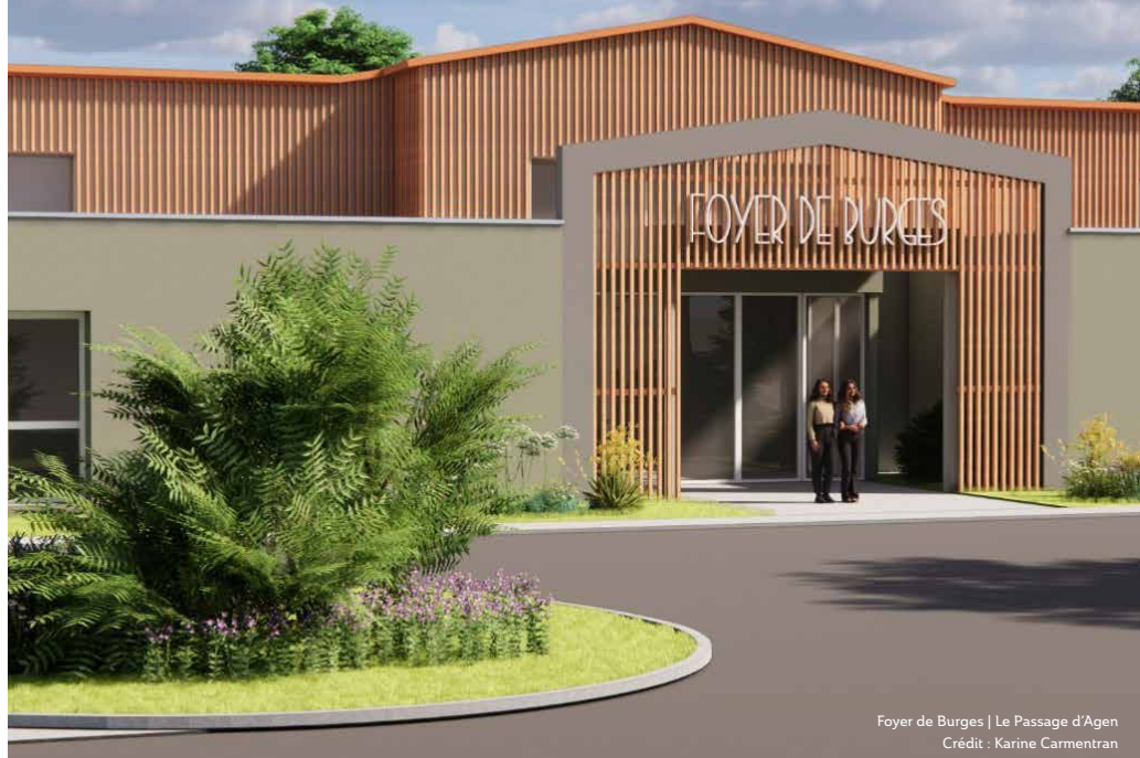
Foyer de Burges | Le Passage d'Agen