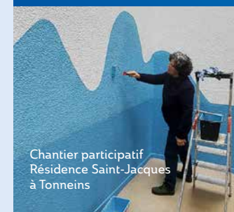
Chantier participatif Résidence Saint-Jacques à Tonneins

« Cela m'a fait plaisir d'apporter quelque chose pour récompenser les équipes d'Habitalys et des Compagnons Bâisseurs qui travaillaient dans la résidence. C'est dans ma culture. Ça m'a paru normal. »